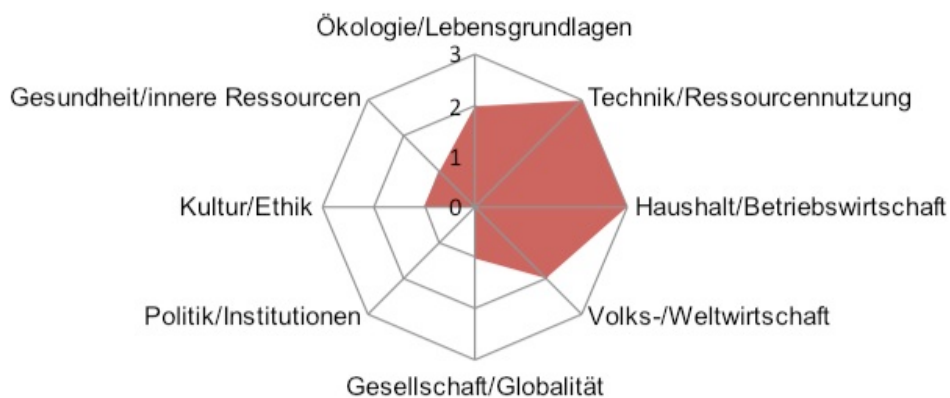
Abb. 2: Themenspider Lektion Das Handy im Abfall (Kyburz-Graber et al., 2010. S.51)

Um die Zuteilung zu den Fächern und Fachbereichen der Lehrpläne zu erleichtern, bilden sie die Schwerpunkte in ihren Lektionseinheiten mit einem „Spider“ ab. Für die Beurteilung der grafischen Darstellung gilt die Faustregel: Wird mindestens je ein Aspekt aus den Bereichen Umwelt, Gesellschaft, Ökonomie mit zwei oder drei bewertet, wird die Lektion dem interdisziplinären Anspruch von BNE gerecht. Werden ein oder mehrere Aspekte mit null bewertet, sollte zur Kompensation ein anderer Bereich mit drei bewertet sein.