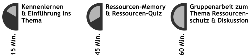
Abb. 4: Ablauf Ressourcenschutz-Workshop

Der Ressourcenschutz-Workshop im Ganzen findet an einem Nachmittag nach der Schule in insgesamt 3 Stunden statt, wobei der inhaltliche und methodische Schwerpunkt auf der soeben skizzierten spielerischen Erarbeitung mit Memory und Quiz liegt. Da es sich bei oikos Paderborn e.V. um einen externen Workshop-Leiter handelt, steht am Anfang des Nachmittags ein Kennenlernen, verbunden mit ersten thematischen Impulsen (u.a. „Was tut ihr, um die Umwelt zu schützen? Trennt ihr beispielsweise den Müll oder fahrt mit öffentlichen Verkehrsmitteln?“).