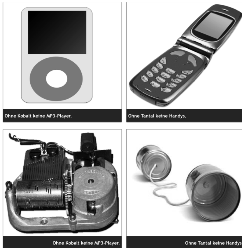
Abb. 3: Rohstoff-Memory Beispielpaare „Kobalt“ und „Tantal“

Entscheidend für das Gelingen dieser Methode ist die Gruppenzusammensetzung (das Spiel kann mit bis zu vier Teams gespielt werden). Eine ausgewogene, heterogene Gruppenstruktur ist ideal, da sich ältere und jüngere Spieler und Spielerinnen in diesem Spiel ergänzen und jede/r Einzelne sich individuell einbringen kann. Das Spiel im Team fördert zudem die Kooperations- und Kommunikationskompetenz der Kinder und Jugendlichen, denn sie gestalten ihre Lernerfahrung in den Gruppen selbst. Der entstehende faire Wettbewerb spornt an und Lernerfolge werden direkt belohnt. Jeder Teilnehmer und jede Teilnehmerin lernt dabei gemäß des persönlichen Vorwissens und Interesses (vgl. Bovet & Huwendiek, 2011).