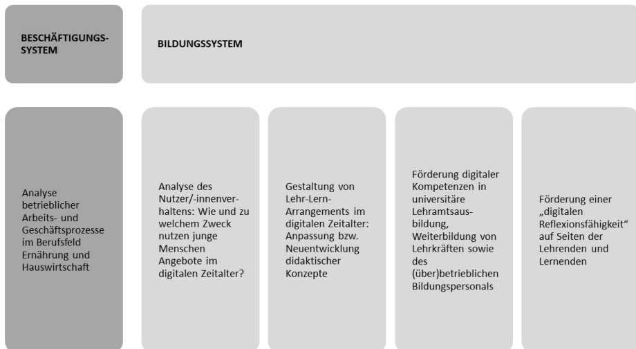
Abb. 2: Handlungsbedarf aus Sicht der Hauswirtschaft