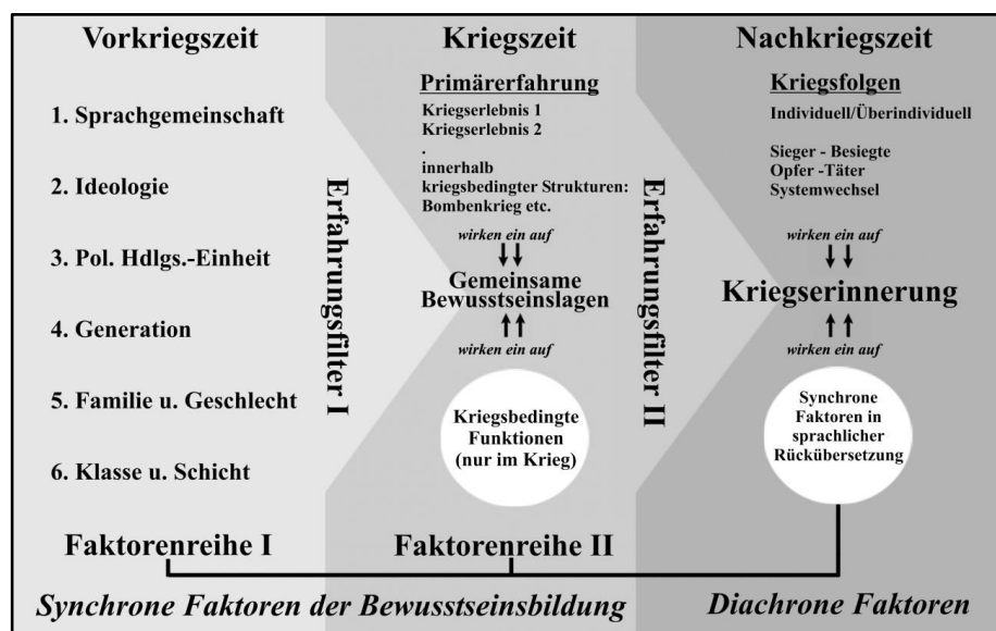
Abb. 2: Synchroner und diachroner Faktoren am Beispiel der Kriegserinnerungen

Die nachfolgende Graphik ist nun der Versuch, diese Faktoren in ihrer Wirkung auf das Bewusstsein vereinfacht abzubilden und damit Kategorien für die weitere Arbeit mit autobiographischen Quellen zu beschreiben.