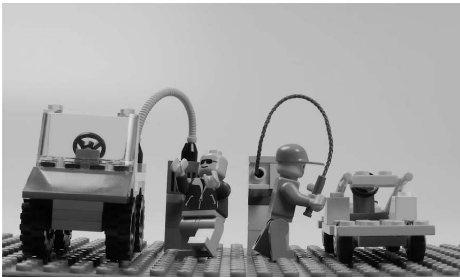
Abbildung 1: Sendungsausschnitt: Lego-Figuren laden Elektroautos auf