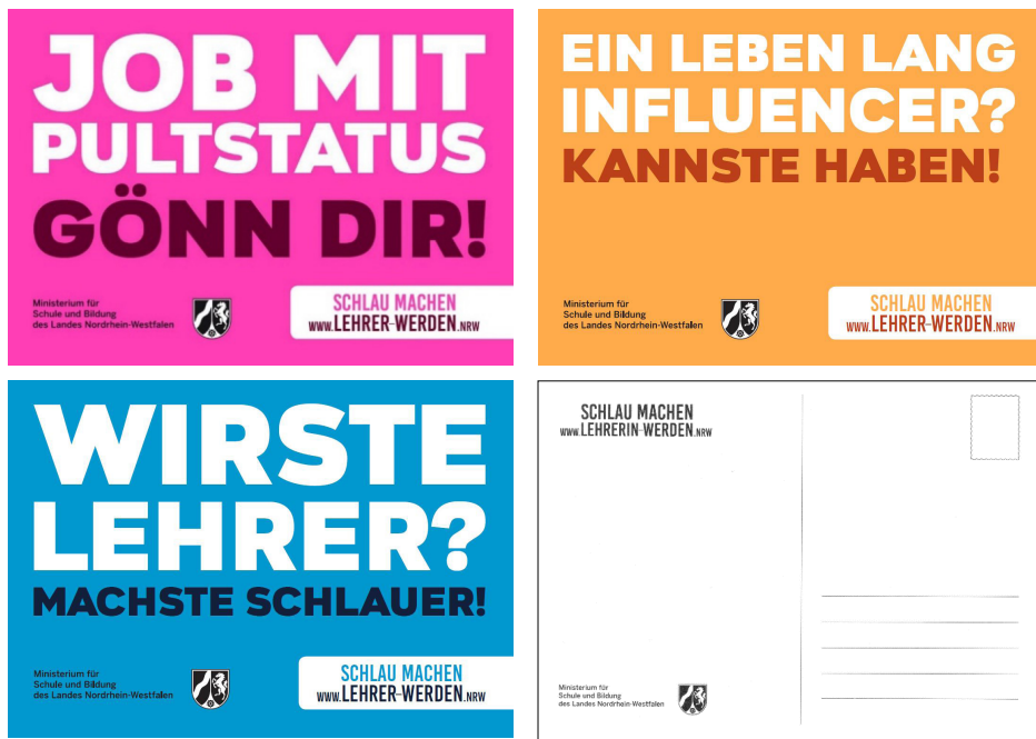
Abbildung 1: Motive der Typografie-Kampagne NRW, 2018 (1-3); Scan der Rückseite (4) 6

In einer Pressemitteilung des Landes Nordrhein-Westfalen gab das Ministerium für Schule und Bildung im April 2018 sowohl die aktuelle Lehrerbedarfsprognose als auch den Start einer Lehrerkampagne („SCHLAU MACHEN – LEHRER WERDEN“) bekannt, wobei die ausgewählten Motive (Abb. 1) der sog. „Typografie-Kampagne“ über Gratispostkarten, Plakate sowie Postings in Social-Media-Kanälen eingeführt wurden. 5